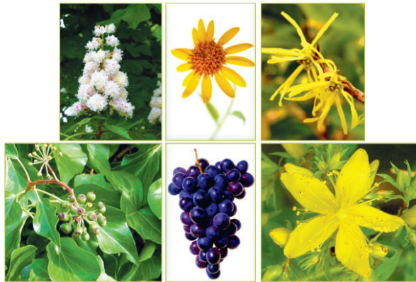
Arnica, castaño de índias, hamamelis, hiedra, hipérico y viña roja