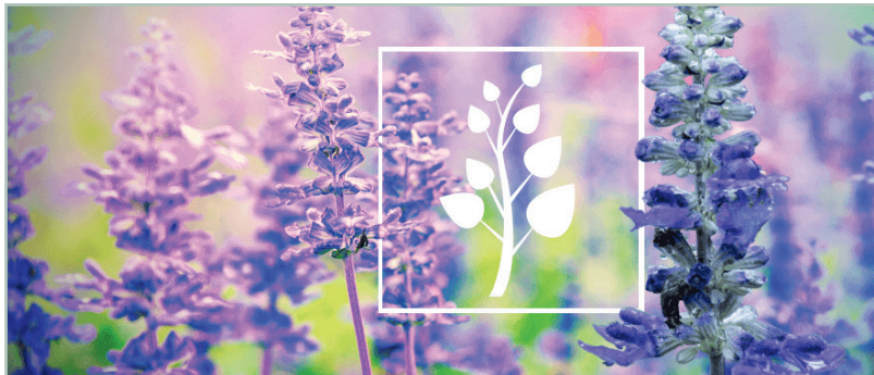
Poliplant Pieles Grasas está compuesto por fucus, bardana, berro, hidra, limón, salvia y saponaria.