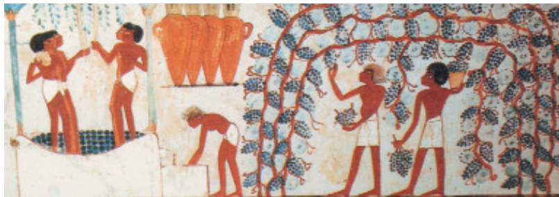
Pintura egípcia que representa a colheita da uva e a elaboração do vinho na época dos faraós.

Catequin, epicatequin, galocatechin, epicatechin 3-O-galato foram isolados nas folhas.